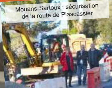
Mouans-Sartoux : sécurisation de la route de Plascassier