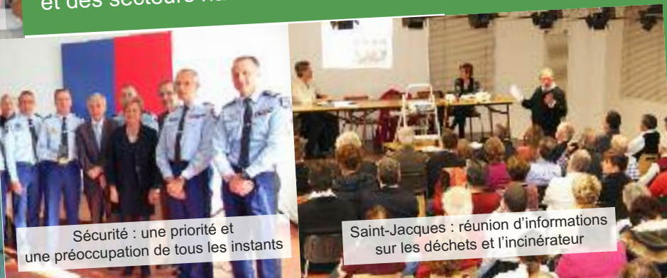
Saint-Jacques : réunion d'informations sur les déchets et l'incinérateur