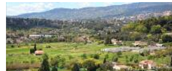
La plaine de St-Marc au Plan de Grasse