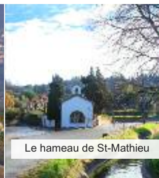
Le hameau de St-Mathieu