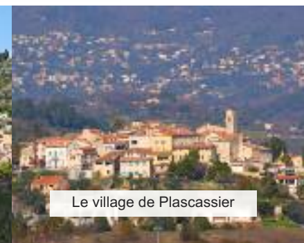
Le village de Plascassier