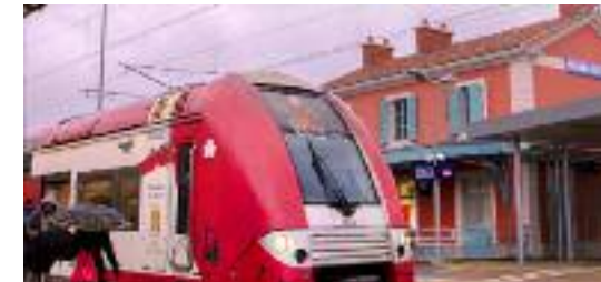
2017 : deux trains/heure sur la ligne Cannes-Grasse, une véritable amélioration des déplacements

Nous continuerons d'être le lien entre la population et ses associations, l'agglomération de Grasse et le Conseil général pour mettre en place rapidement ces solutions.