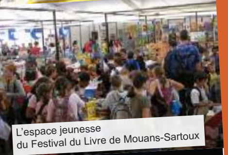
L'espace jeunesse du Festival du Livre de Mouans-Sartoux