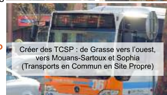
Créer des TCSP : de Grasse vers l'ouest, vers Mouans-Sartoux et Sophia (Transports en Commun en Site Propre)