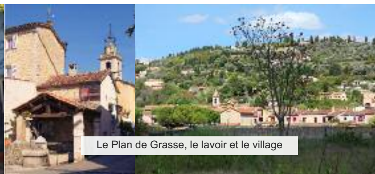
Le Plan de Grasse, le lavoir et le village