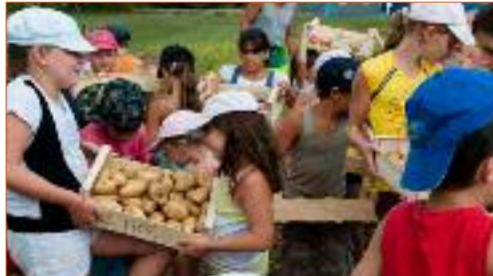
Des écoliers ramassent des pommes de terre à la régie agricole de Mouans-Sartoux pour la cantine 100 % bio