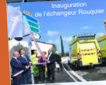
Inauguration de l'échangeur Rouquier