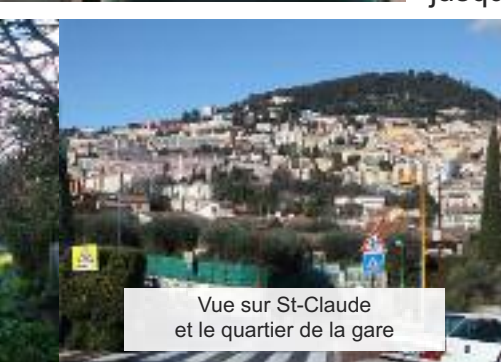
Vue sur St-Claude et le quartier de la gare