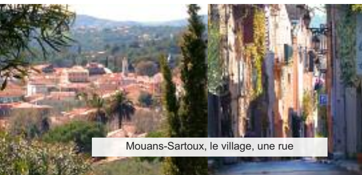
Mouans-Sartoux, le village, une rue