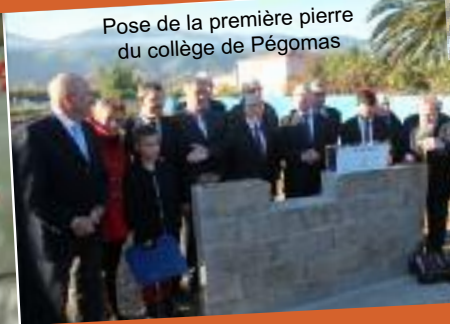
Pose de la première pierre du collège de Pégomas