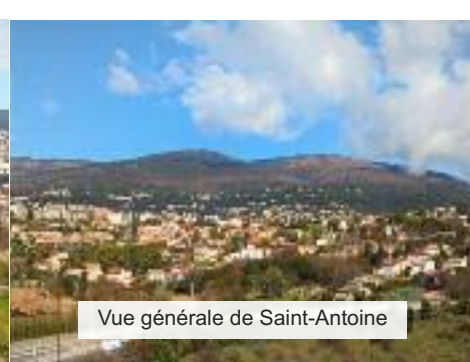
Vue générale de Saint-Antoine