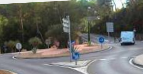
Mougins-Le Haut : aménagement du rond-point d'accès