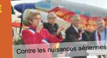
Contre les nuisances aériennes