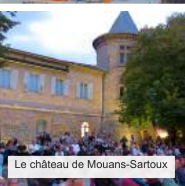
Le château de Mouans-Sartoux