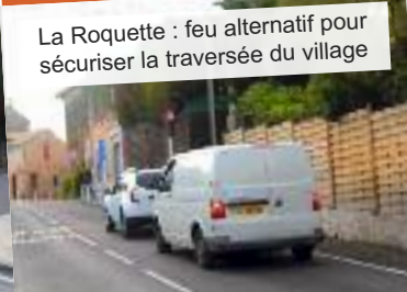
La Roquette : feu alternatif pour sécuriser la traversée du village