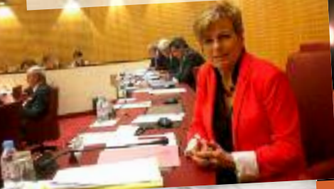
Dans l'hémicycle du Conseil général