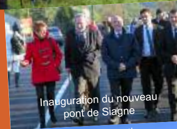
Inauguration du nouveau pont de Siagne

Pour les travaux de la commune : 1,8 million € de subventions du Conseil général (bassin d'eau potable, caserne des pompiers, rues du village, parc du Château, ...)