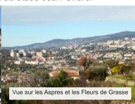
Vue sur les Aspres et les Fleurs de Grasse