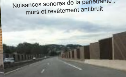
Nuisances sonores de la pénétrante : murs et revêtement antibruit