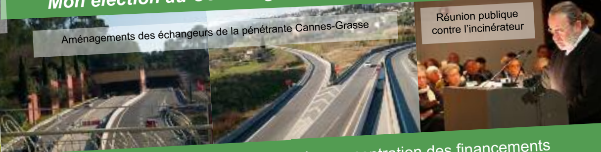
Réunion publique contre l'incinérateur