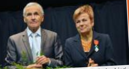
Décorée de la Légion d'Honneur par A. Aschieri